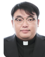
강석현 라파엘 녹양동 성당