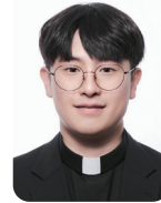
함현호 다니엘 지금동 성당