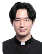
박재형 도미니코 교하 성당