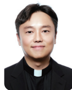
김문식 마리아 원당 성당