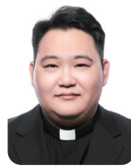
김영훈 히지노 송산 성당