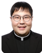
장원제 안드레아 대화마을 성당 첫미사: 2월 4일(주일) 오전 11시